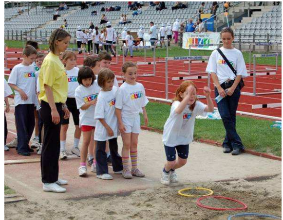
Initiation au saut en longueur lors de la Journée olympique à Zagreb.