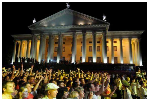
Foule nombreuse au Festival «Sotchi, Oui!».

Le 4 juillet, Sochi a accueilli le festival «Sotchi, Oui!», à l'occasion de la commémoration de l'élection de Sochi comme ville hôte des Jeux Olympiques et Paralympiques d'hiver de 2014 . Cet événement a été organisé dans le cadre de l'Olympiade culturelle 2014, qui a débuté le 17 mai. Plusieurs artistes, musiciens, athlètes et des milliers de résidents de Sochi ont assisté aux célébrations, qui ont inclus divers événements sportifs en journée et un concert grandiose en soirée. A noter que lors de cette journée, Alexey Voevoda, médaillé d'argent en bobsleigh aux Jeux de 2006 et médaillé de bronze aux Jeux de 2010, a rejoint