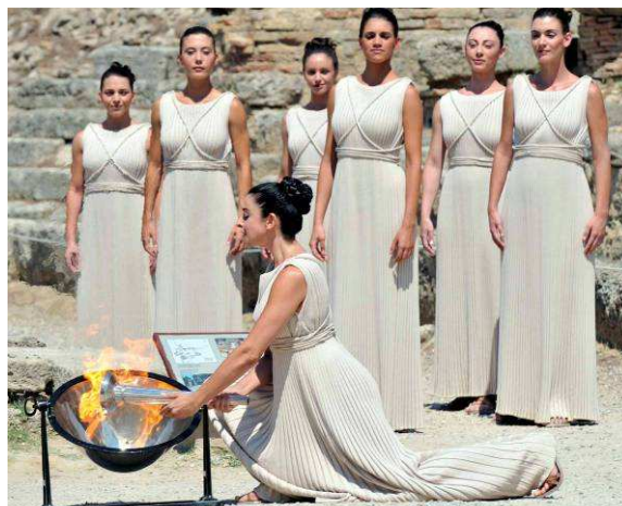
Allumage de la flamme olympique de la jeunesse à Olympie.

Le voyage de la flamme olympique de la jeunesse a débuté le 23 juillet à Olympie (Grèce) avec l'allumage symbolique de la flamme. Au cours des 22 jours restant avant les premiers Jeux Olympiques de la Jeunesse (JOJ) à Singapour, quelque 2400 relayeurs amèneront la flamme sur les cinq continents. Initié par le comité d'organisation de ces Jeux, ce voyage passera par Berlin (Allemagne) le 24 juillet, Dakar (Sénégal) le 26 juillet, Mexico City (Mexique) le 30 juillet, Auckland (Nouvelle-Zélande) le 1er août et Séoul (Corée) le 4 août. Un relais national de six jours commencera alors le 5 août avec comme destination finale, Singapour, où les JOJ auront lieu du 14 au 26 août. Communiqué complet sur www.olympic.org (section 'actualités').