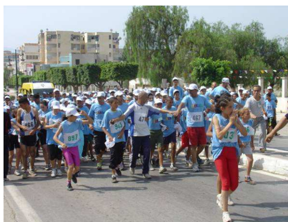
Départ de la course olympique dans la ville de Bejaia.

Le CNO algérien a célébré la Journée olympique à travers des compétitions et démonstrations sportives, ainsi que de diverses autres activités culturelles et artistiques qui se sont déroulées le 17 juillet dernier dans les villes de Bejaia, Alger, Skikda et Oran.