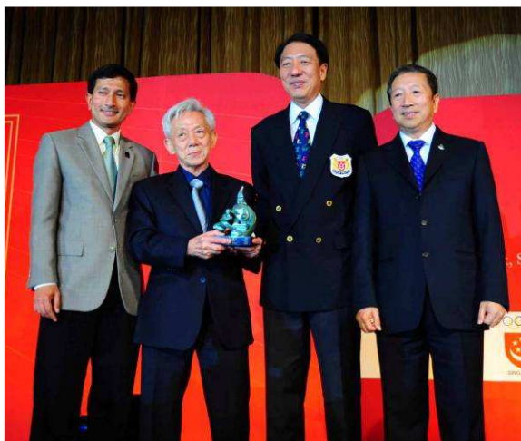
(de g. à d.) Vivian Balakrishnan, Tan Howe Liang, Teo Chee Hean et Ser Miang Ng.