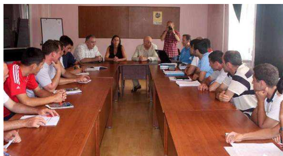
Cours théorique au stage pour entraîneurs de tennis à Tbilissi.

Le CNO américain a annoncé le décès le 13 juillet dernier de George Steinbrenner à l'âge de 80 ans. Steinbrenner avait été vice-président du CNO de 1989 à 1996.